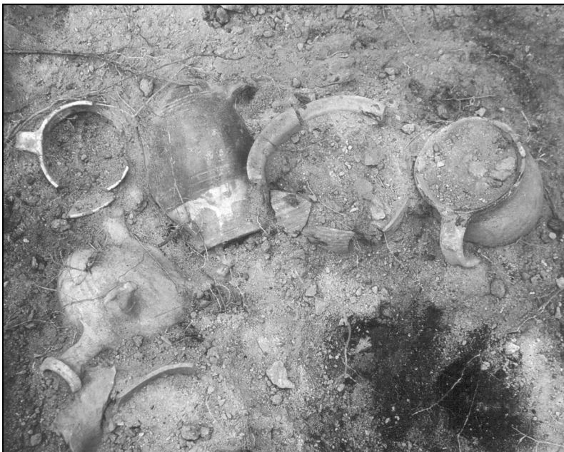
Ilustr. 2. Część ceramiki odkrytej we wnętrzu piwnicy oficyny przy ul. Bolesława Krzywoustego 2-4 w trakcie interwencyjnych badań archeologicznych przy przebudowie sieci ciepłej na Starym Mieście w Stargardzie w 2003 r.