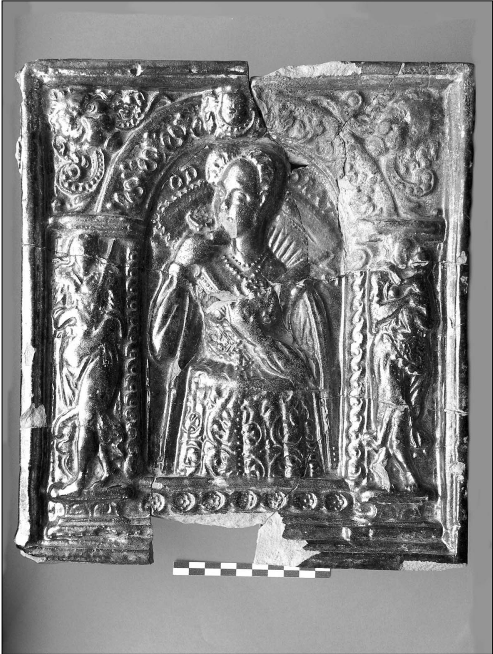
Ilustr. 6. Stargard, ul. Bolesława Krzywoustego 2-4, kafel z personifikacją zmysłu „Pownienia”.