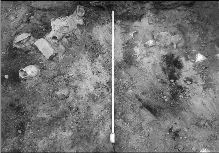
Ilustr. 1. Wnętrze piwnicy oficyny przy ul. Bolesława Krzywoustego 2-4 odkrytej w trakcie interwencyjnych badań archeologicznych przy przebudowie sieci ciepłej na Starym Mieście w Stargardzie w 2003 r.