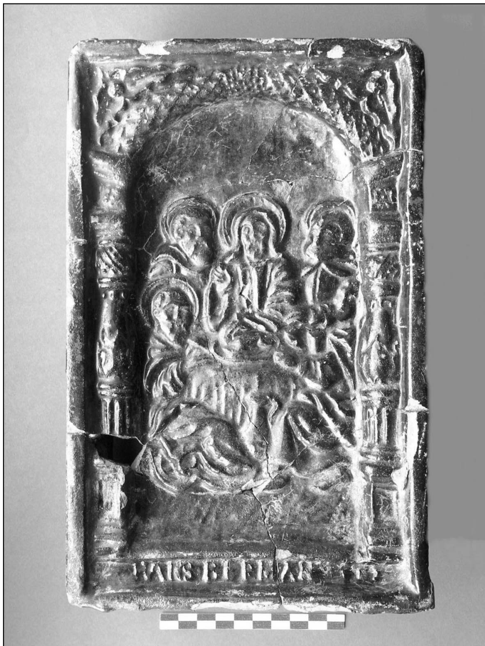
Ilustr. 4. Stargard, ul. Bolesława Krzywoustego 2-4, kafel z warsztatu Hansa Bermana ze sceną „Ostatniej Wieczerzy”.