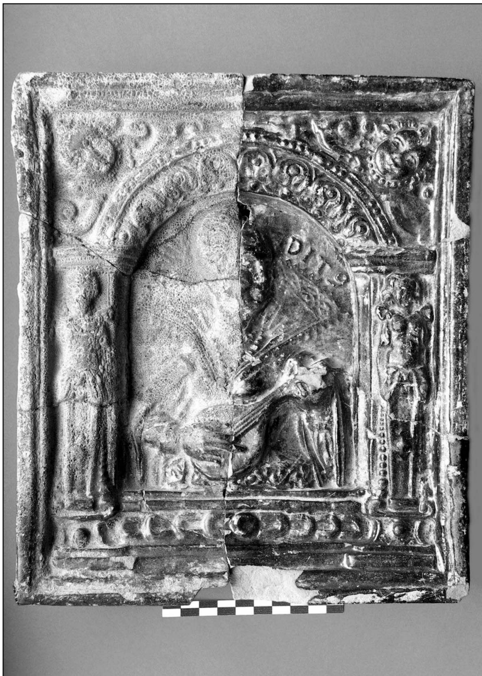
Ilustr. 5. Stargard, ul. Bolesława Krzywoustego 2-4, kafel z personifikacją zmysłu „Słuchu”.